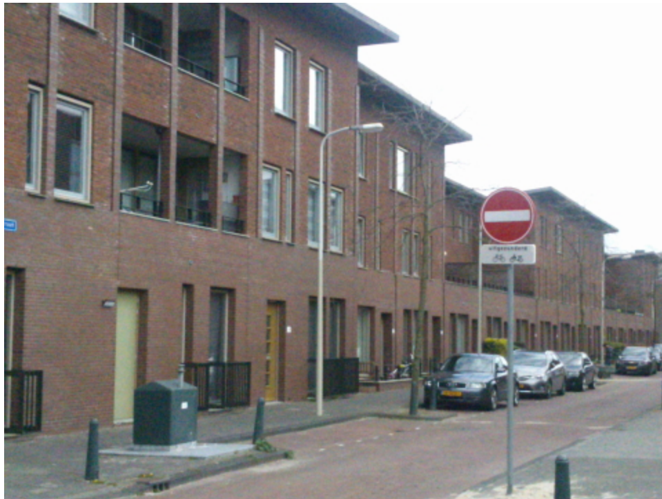
Huizen in Spoorwijk, aangesloten op de installaties van Greenspread

ACM moet toezicht houden op de verkoop van energie-installaties door energiebedrijven aan private partijen