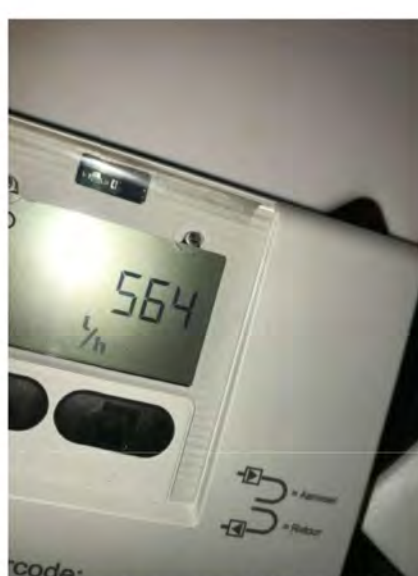
foto 4 levering na reiniging filter