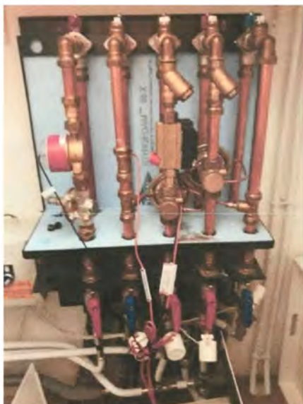
foto 1 afleverset oorspronkelijk

Uw kenmerk : 6.20.118594 Betreft : installatie-technisch onderzoek Kenmerk : 20201204.2 Blad : fotoblad 1