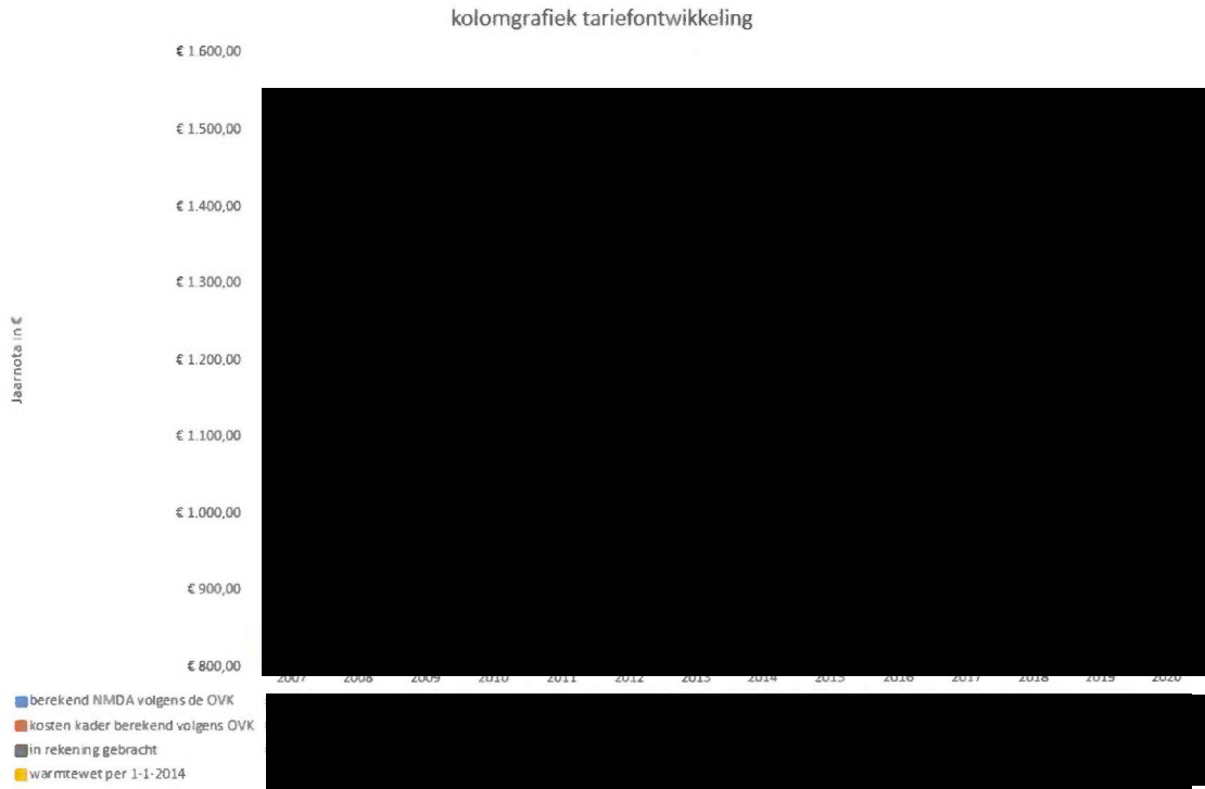
Figuur 3: lijngrafiek tariefontwikkeling

Het geheel van berekeningen resulteert in onderstaande grafische weergave van tariefontwikkeling 2007 – 2020.