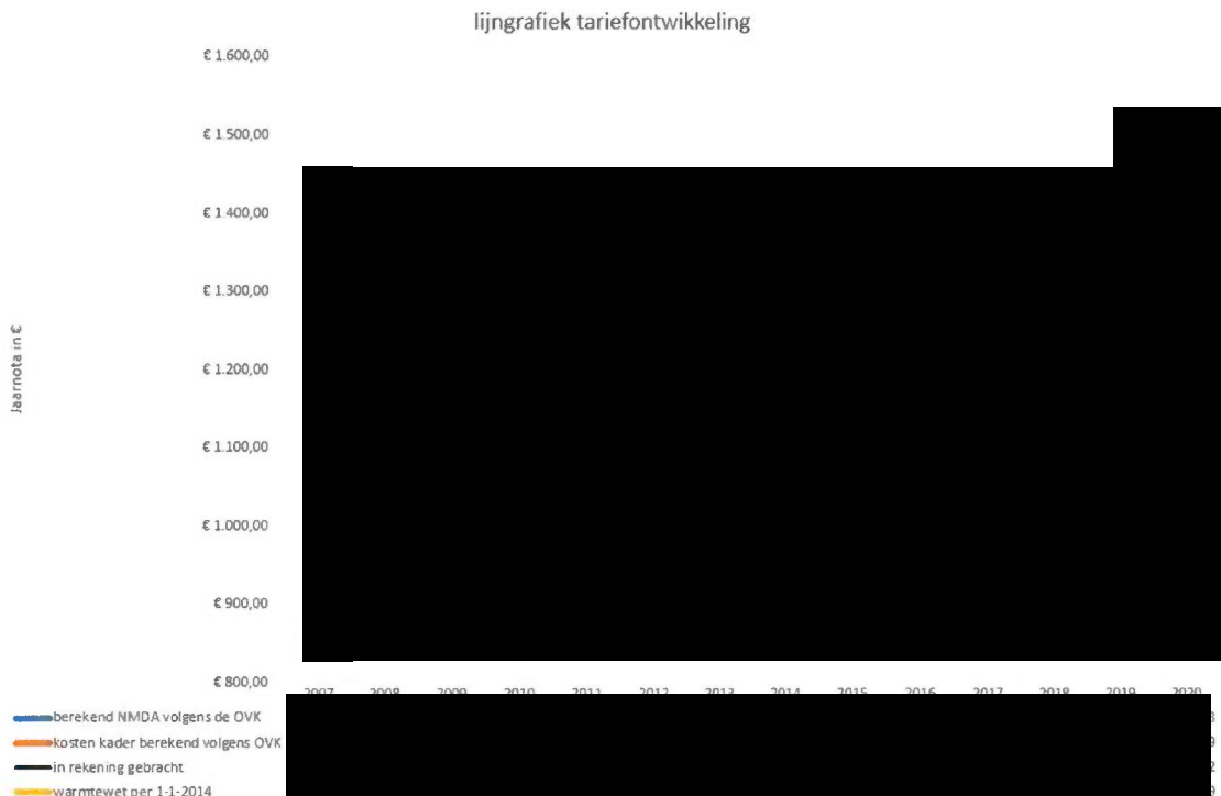
Figuur 4: kolomgrafiek tariefontwikkeling